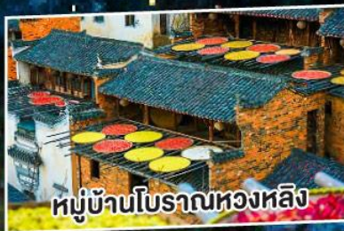
หมู่บ้านโบราณหวงหลิง

ทริปเดียวเที่ยว 3 มณฑล หูหนาน เจียงซี เจ้อเจียง