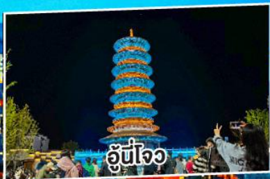
อู่หนี่โจว

หูเปาฉีเจียนกู่ ล่องเรือทะเลสาบซีหู 5 วัน 4 คืน