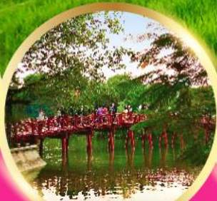
ทะเลสาบคินคาบ