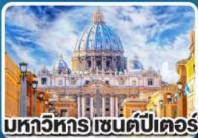
มหาวิหารเซนต์ปีเตอร์