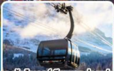
กระเช้า ไอเกอร์เอ็กสเพรส สู่อยอดเขาจุงเฟรา

อิตาลี สวิตเซอร์แลนด์ ฝรั่งเศส 10 วัน 7 คืน