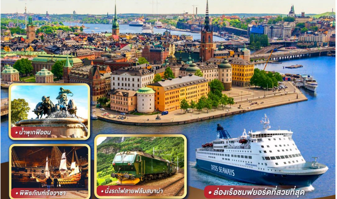
• น้ำพุเทพีออน